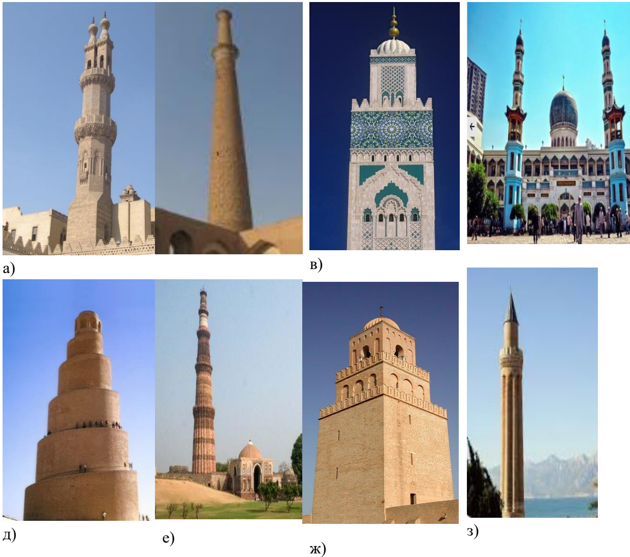
Расм-3. Минораларнинг конструктив шакллари

Ҳозирги кунга келиб юртимизда минглаб тарихий-меъморий обидалар, ва иншоотларни, монументал санъат ёдгорликлари барпо этилган тарихий аҳамиятга молик шаҳарларимиз дунё тарихи цивилизациясида алоҳида ўринга ва эътиборга эга. Уларни тадқиқ қилиш, ўрганиш, реконструкция қилиш ва сақлаб қолиш муҳим аҳамият касб этади. Бир қанча олимлар, тарихий-меъморий обидаларни археологияси, архитектураси ва конструкцияси билан шуғулланиб келган. Ушбу олимларга М.Е.Массон, Г.А.Пугаченкова, Б.Н.Засипкин, Л.И.Ремпель, Е.В.Михайловский, Б.А.Ржаницын, И.И.Ноткин, П.Ш.Зоҳидов, К.С.Крюков, Х.К.Богодухов, А.Ф.Мухитдинов, Б.В.Шварцларни киритиш жоиздир.